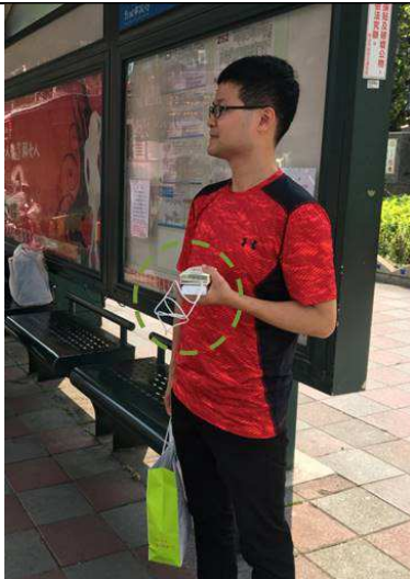
PM 2.5 暴露量監測-公車 (候車轉乘)