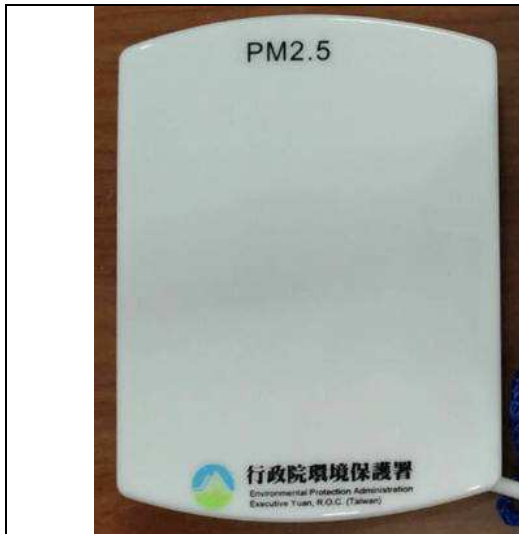
PM 2.5 微型感測器-實體