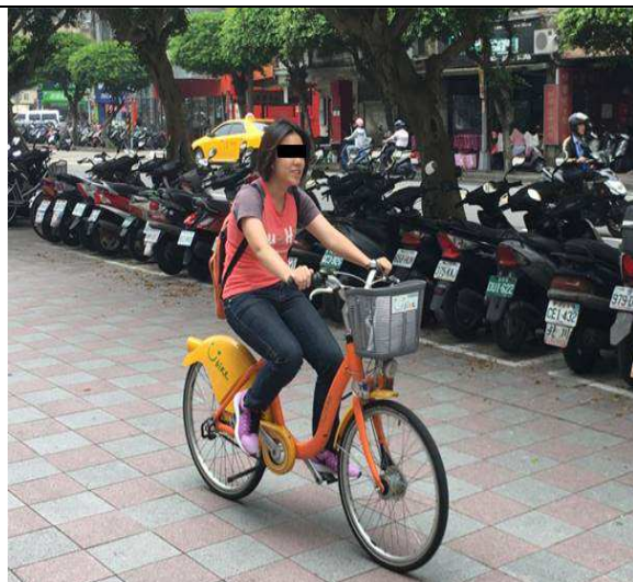
PM 2.5 暴露量監測-腳踏車