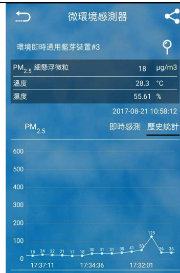
PM 2.5 微型感測器-APP 軟體